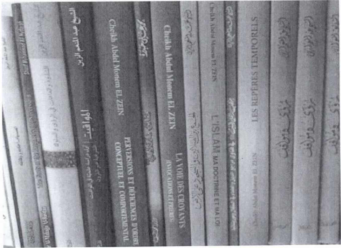
زاوية من مكتبة الشيعة الإمامية في السنغال