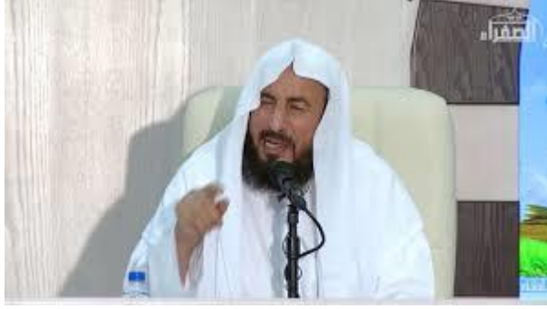
شيخنا ناصر القفاري حفظه الله تعالى