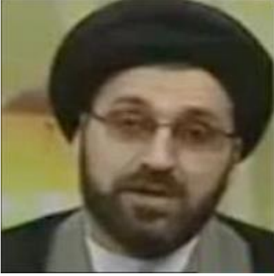
إخبارية عرعر - النجف

النجف؛ في برنامج كم جاء ردا على متصل افتي احد ايات الشيعة بجواز الهروب من صيام رمضان بالسفر يوميا لمسافة 25 وستكون "آب" و"تموز" الفرات سأل : أنه في رمضان سيأتينا "قناة على الأشرف" فهل يجوز تأخير صيام رمضان إلى شهر آخر؟ الحرارة شديدة